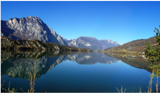
Lago di Cavedine – Cicloescursione Val Lomasona (TN)