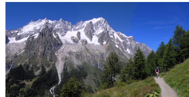
I Balconi della Valle d'Aosta - Balconata della Val Ferret