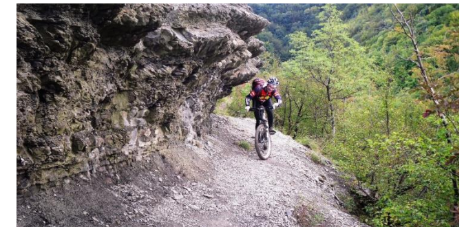
Appennino Romagnolo - Un passaggio della discesa Zuccherodante